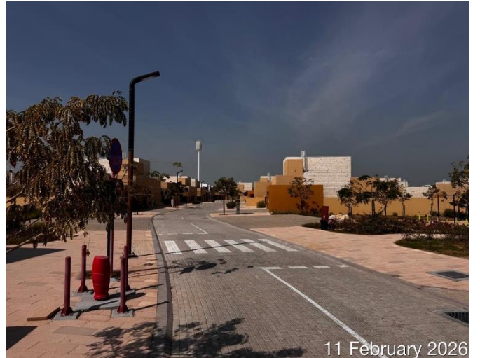
11 February 2026