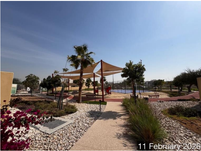
11 February 2026