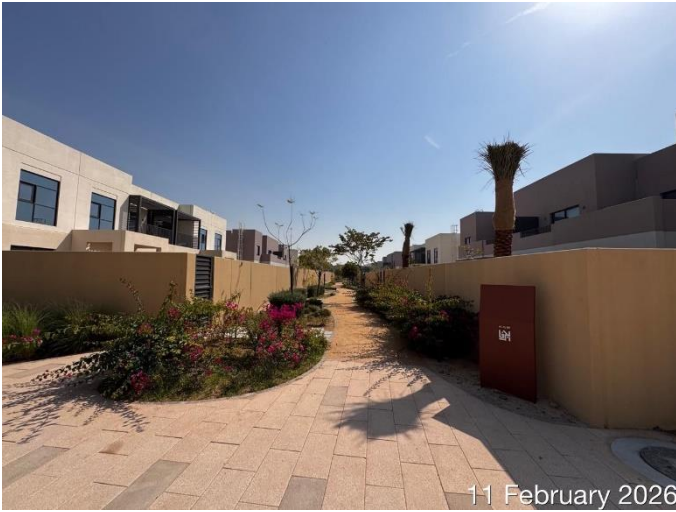
11 February 2026