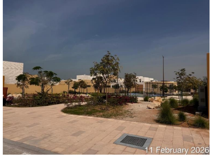
11 February 2026