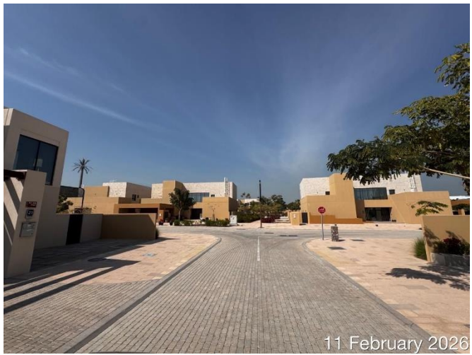
11 February 2026