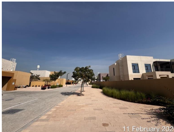
11 February 2026