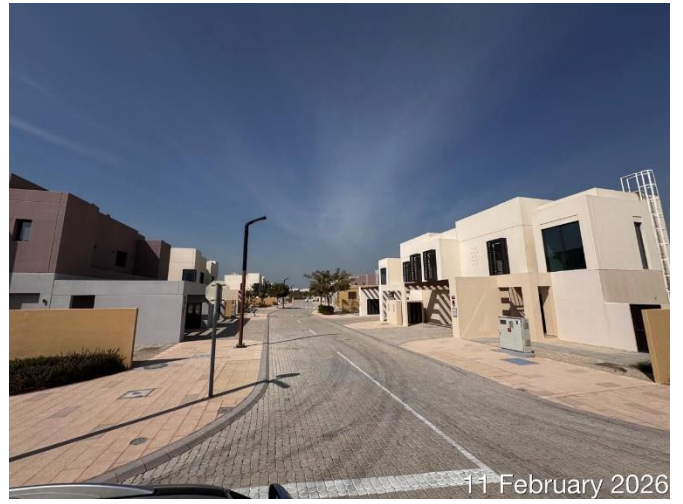
11 February 2026