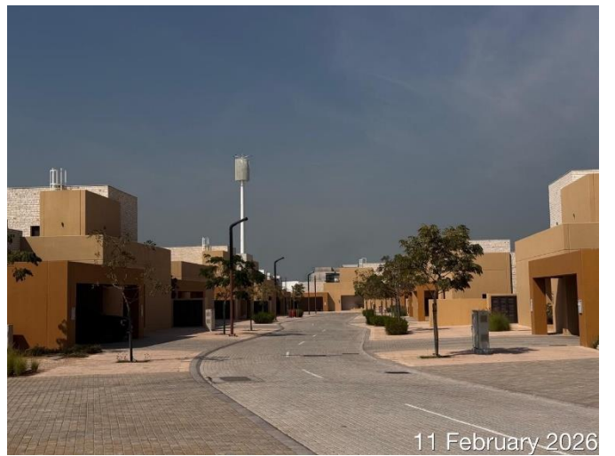
11 February 2026