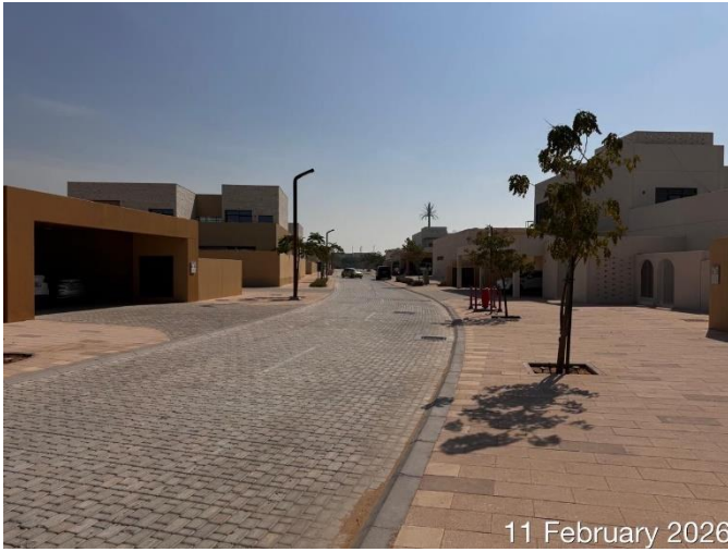
11 February 2026