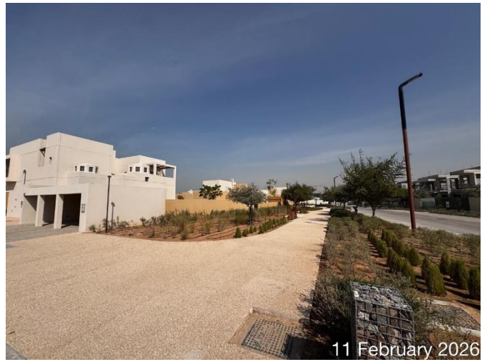
11 February 2026