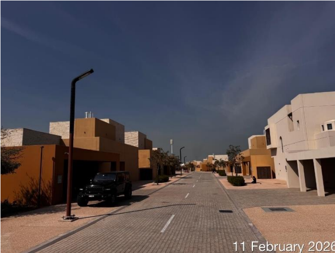
11 February 2026