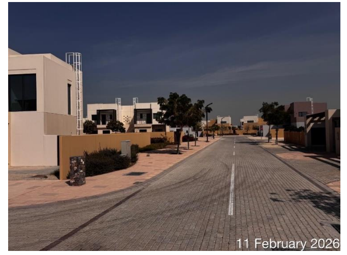
11 February 2026