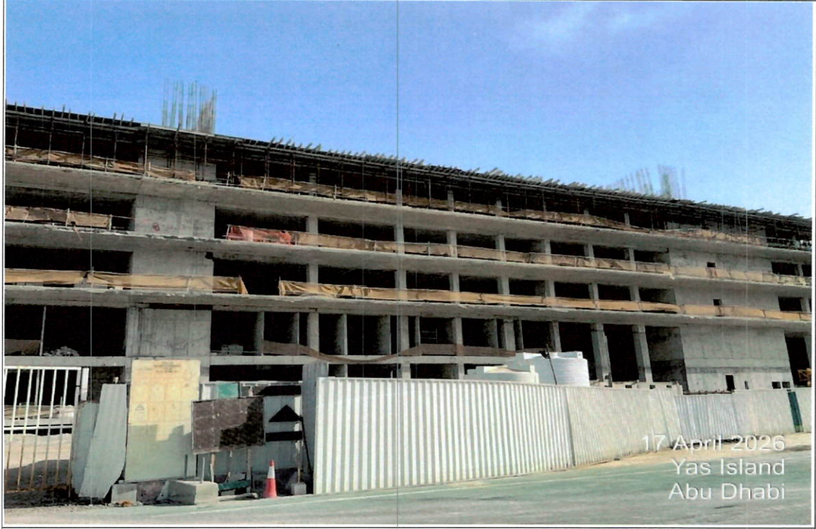
صور الموقع والمشروع