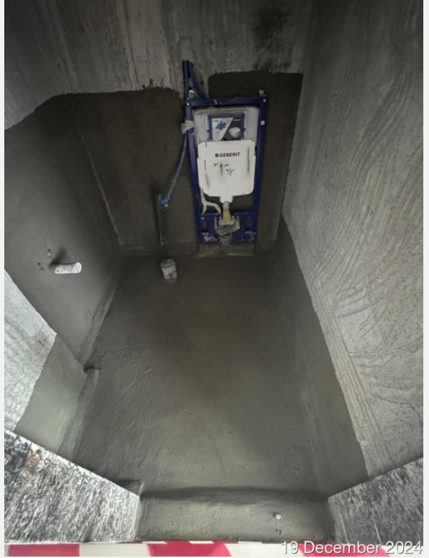
19 December 2024