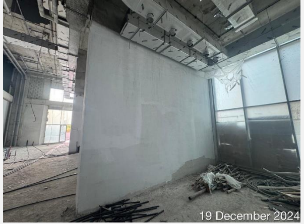
19 December 2024