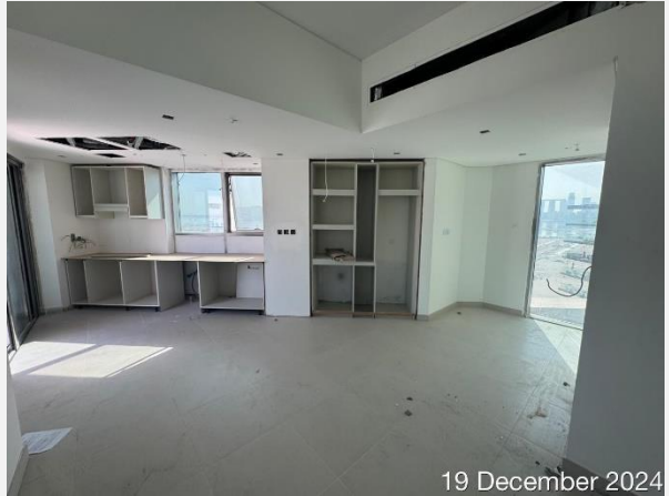
19 December 2024