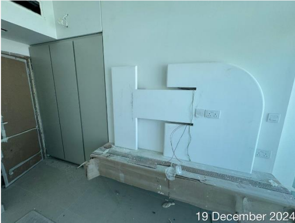
19 December 2024