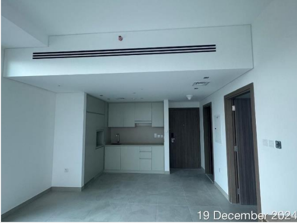
19 December 2024