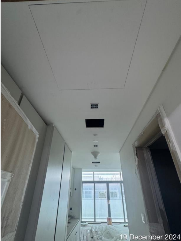
19 December 2024