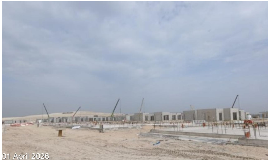
01 April 2026