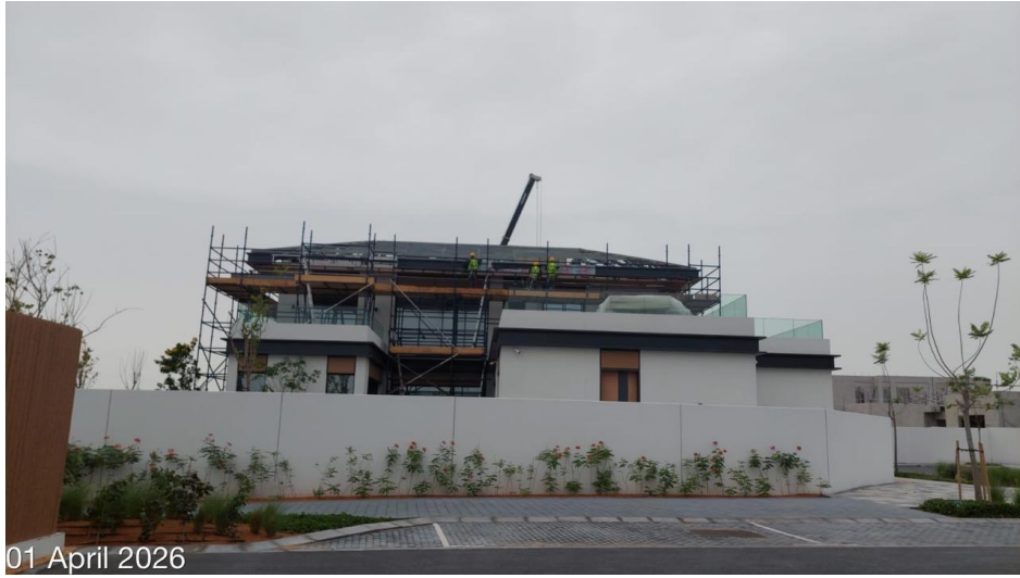
01 April 2026