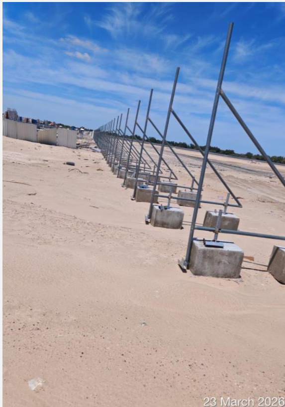
23 March 2026