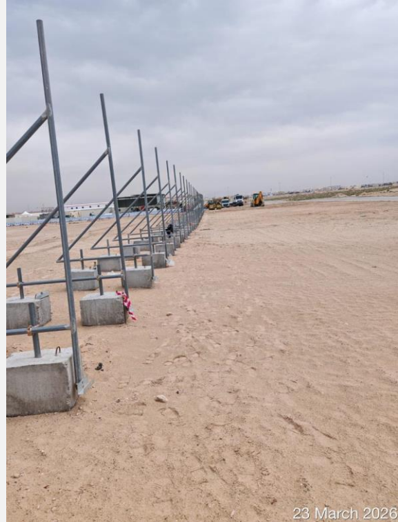
23 March 2026