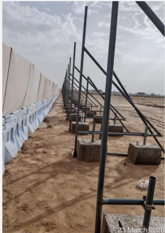
23 March 2026