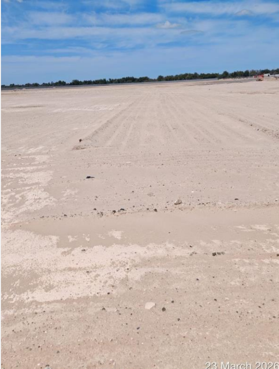
23 March 2026